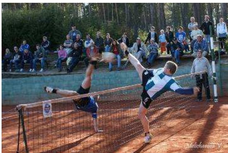
Fotka z utkání AC Zruč-Senec vz NK CLIMAX Vsetín