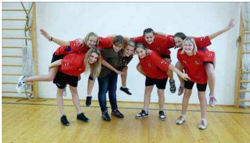
Vítězky krajské soutěže