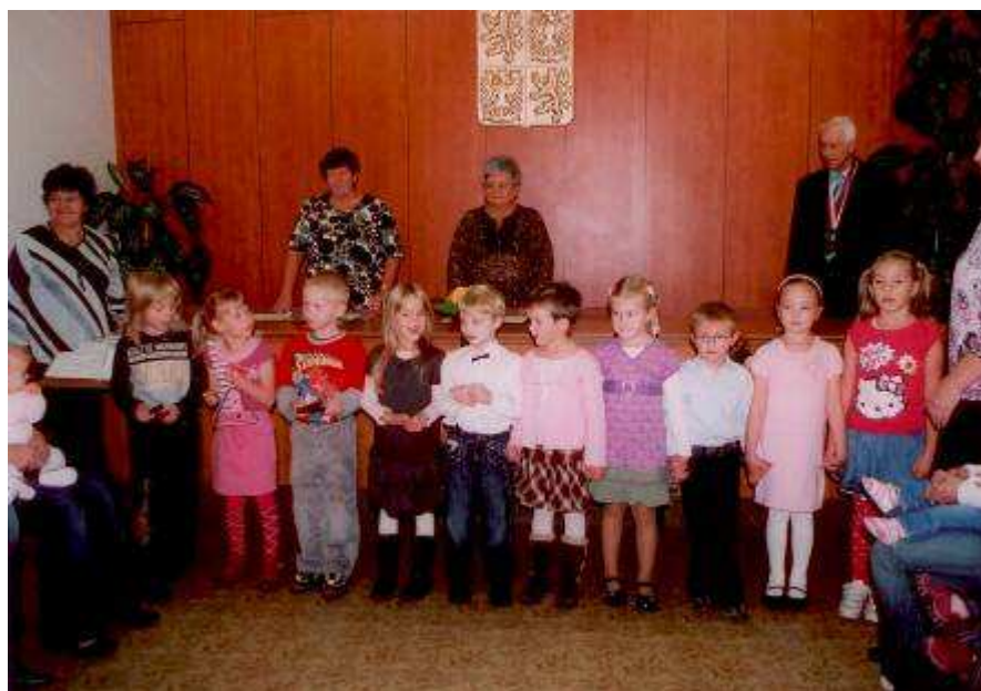
Pro druhé vítání si připravily vystoupení děti z naší mateřské školky.