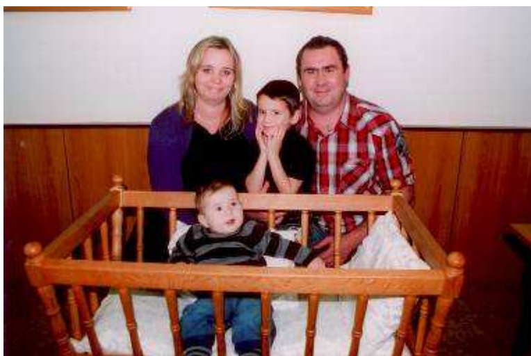
Dářečky pro maminku a dítě zůstávají stejné jako při posledním vítání. Děti dostávají praktické přístroje, pamětní list a účet Čtyřlístek u ČSOB s vkladem 500,- Kč. Maminka dostává kytičku a také fotografie z vítání na OÚ zdarma.