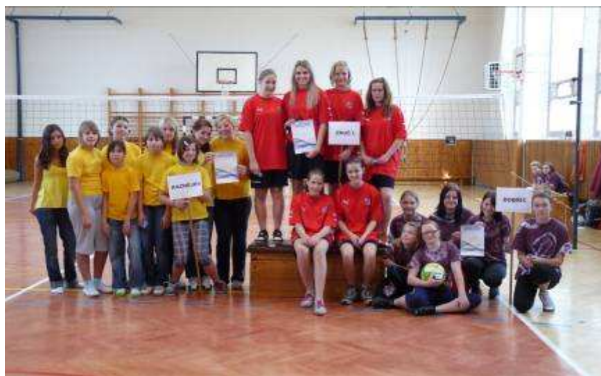
Vítězky přeboru RC Plzeň-sever Děvčatům se letos podařil husarský kousek, kdy v přehazované vyhrály obě soutěže!